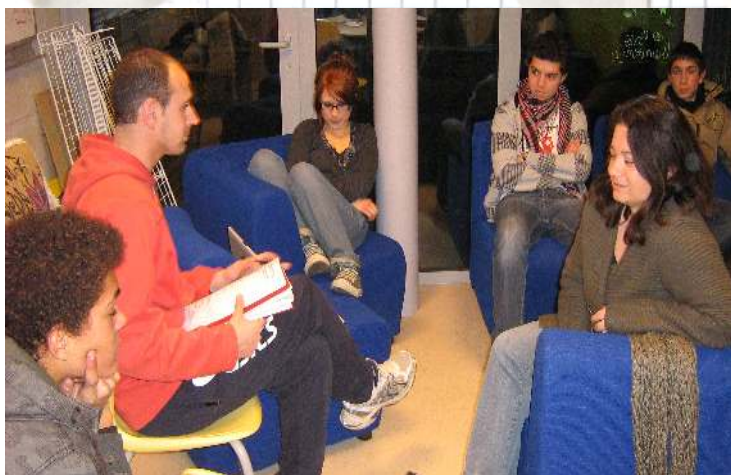
La réunion du mercredi 14 janvier, en présence des jeunes et des parents pour présenter le séjour